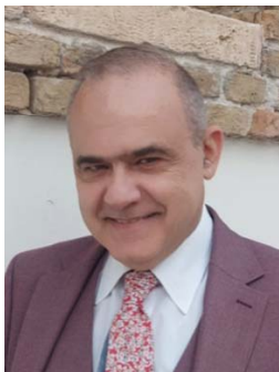
ΔΡ. ΑΝΤΩΝΗΣ ΖΑΪΡΗΣ

Ο καθηγητής του Πανεπιστημίου Νεάπολης Πάφου απαντά στον Λάμπρο Μπέλεση σε ερωτήσεις για το βιβλίο του Ο ΜΕΓΑΛΟΣ ΜΕΤΑΣΧΗΜΑΤΙΣΜΟΣ