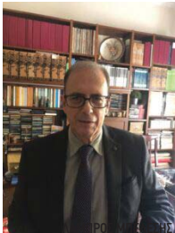
ΔΙΕΥΘΥΝΩΝ ΣΥΜΒΟΥΛΟΣ ΤΗΣ BBC CONSULTING SA ΑΝΤΙΠΡΟΕΔΡΟΣ ΠΑ.Ε.Λ.Ο. & ΣΥΝΤΟΝΙΣΤΗΣ ΟΜΑΔΑΣ ΣΥΝΤΑΞΗΣ ΤΩΝ ΝΕΩΝ ΤΗΣ ΠΑΕΛΟ

Για το πώς προχωρεί το mydata η απάντησή μου είναι αργά και βασανιστικά για όλους