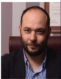
ΣΤΑΥΡΟΣ ΓΡΑΜΜΑΤΙΚΟΠΟΥΛΗΣ ΛΟΓΙΣΤΙΚΕΣ ΥΠΗΡΕΣΙΕΣ

Επειδή αυτός ο τρόπος αξιολόγησης απέβαλε πολλές επιχειρήσεις από το πρόγραμμα της περιφέρειας και με δεδομένο ότι η κρίση συνεχίζεται, προτείνουμε να δοθεί το δικαίωμα σε όσες επιχειρήσεις έχασαν για παρόμοιους λόγους το πρόγραμμα και είχαν μεγάλη βαθμολογία άρα είχαν και άμεση ανάγκη για επιστολή κόντα να υποβάλουν αίτημα επαναξιολόγησης αν η απόρριψη οφείλεται σε παρόμοιους λόγους.