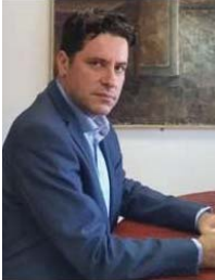
ΦΩΤΗΣ ΚΟΥΡΜΟΥΣΗΣ ΕΙΔΙΚΟΣ ΓΡΑΜΜΑΤΕΑΣ ΙΔΙΩΤΙΚΟΥ ΧΡΕΟΥΣ

Εύχομαι η νέα χρονιά να φέρει περισσότερη υγεία, χαρά και ευημερία και λιγότερα χρέη! Χαιρετισμούς!